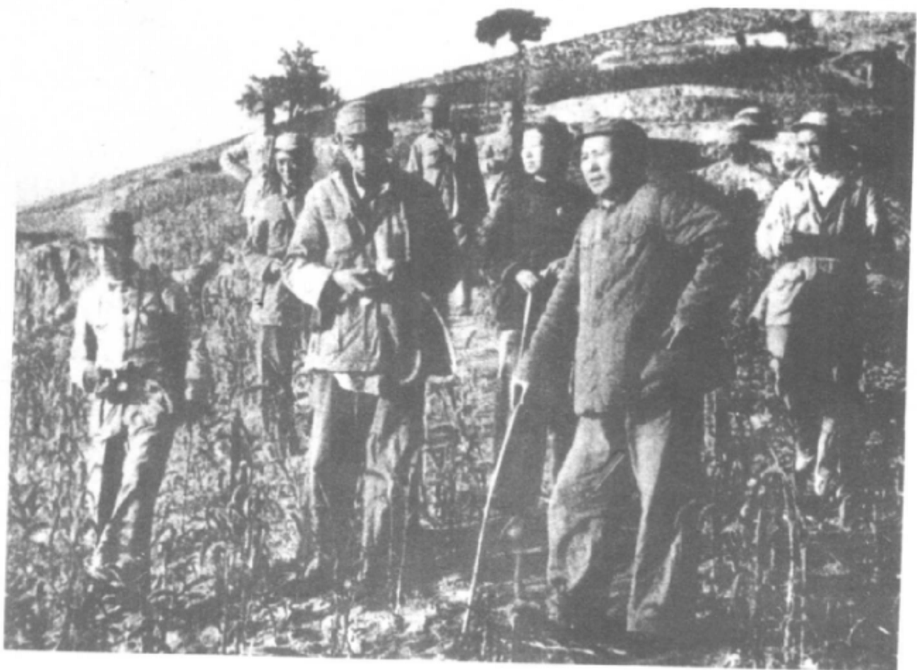
1947年，毛泽东 在转战途中。