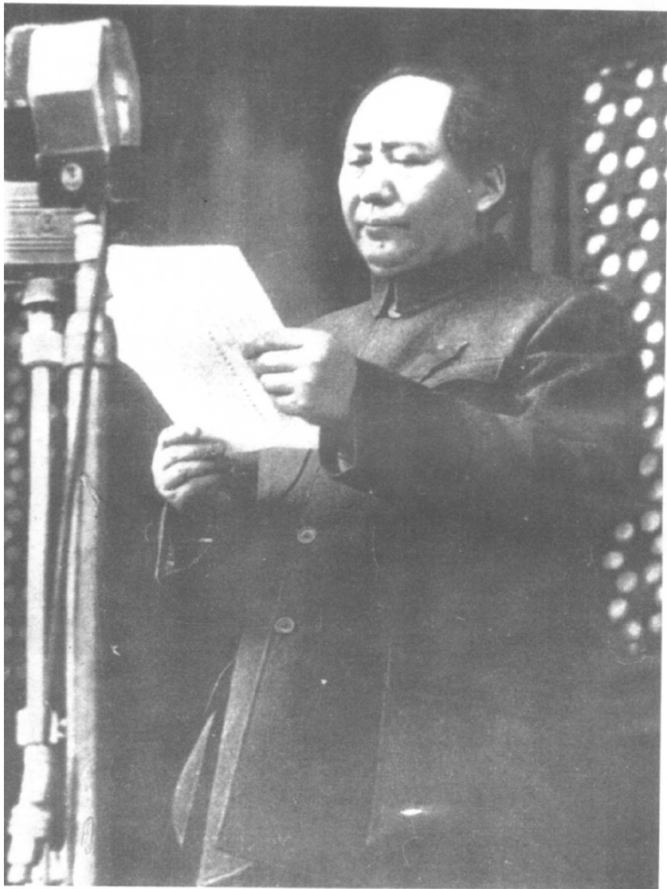
1949年10月1日，毛泽东庄严宣告中华人民共和国成立。