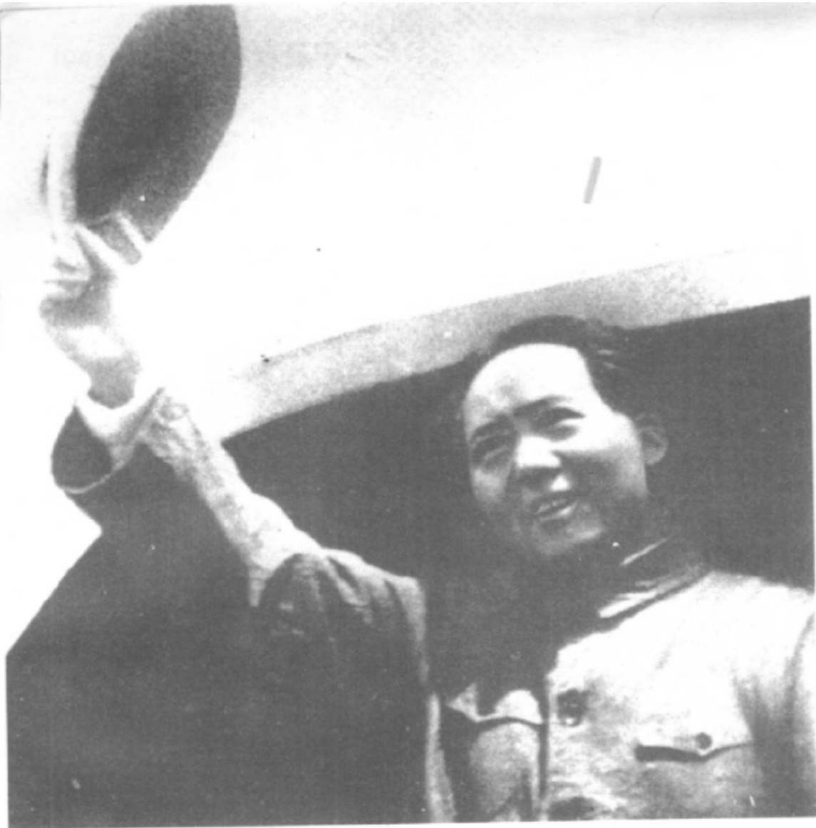
1945年8月，为争取国内和平，毛泽东在周恩来等的陪同下亲赴重庆谈判。图为他在延安机场向送行的军民挥帽告别。