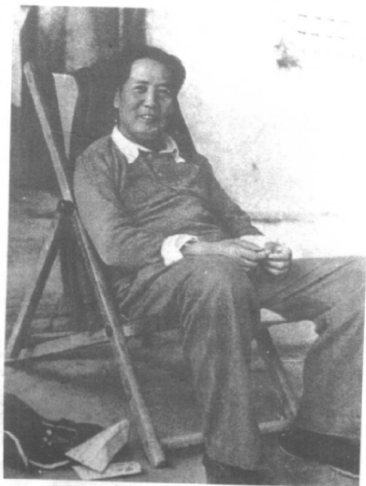
1948年，毛泽东在西柏坡。