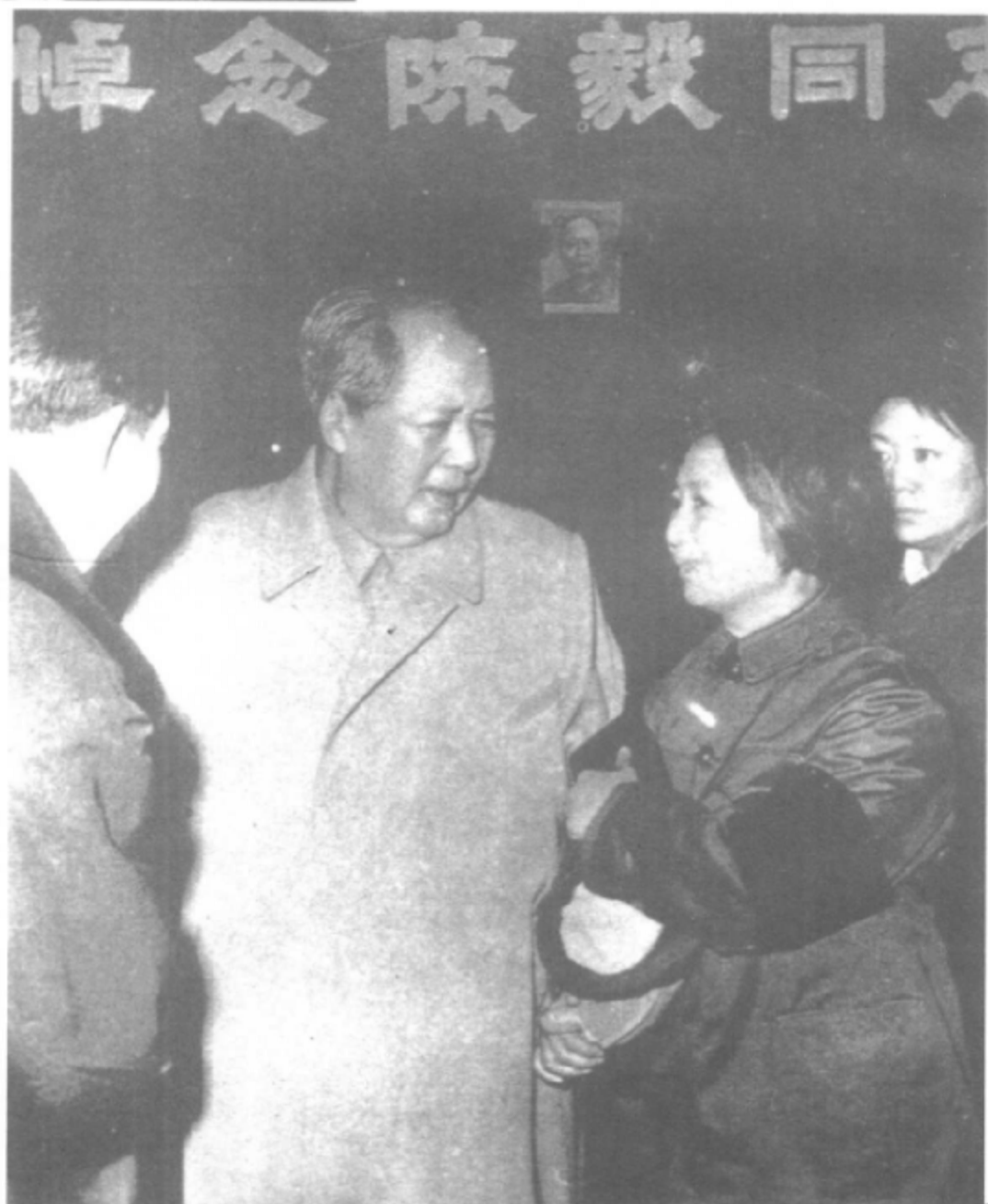
一九七二年一月十日，毛泽东到八宝山参加陈毅追悼会。