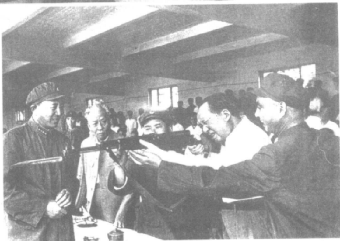
一九六四年，毛泽东在北京，济南部队军事训练表演现场。