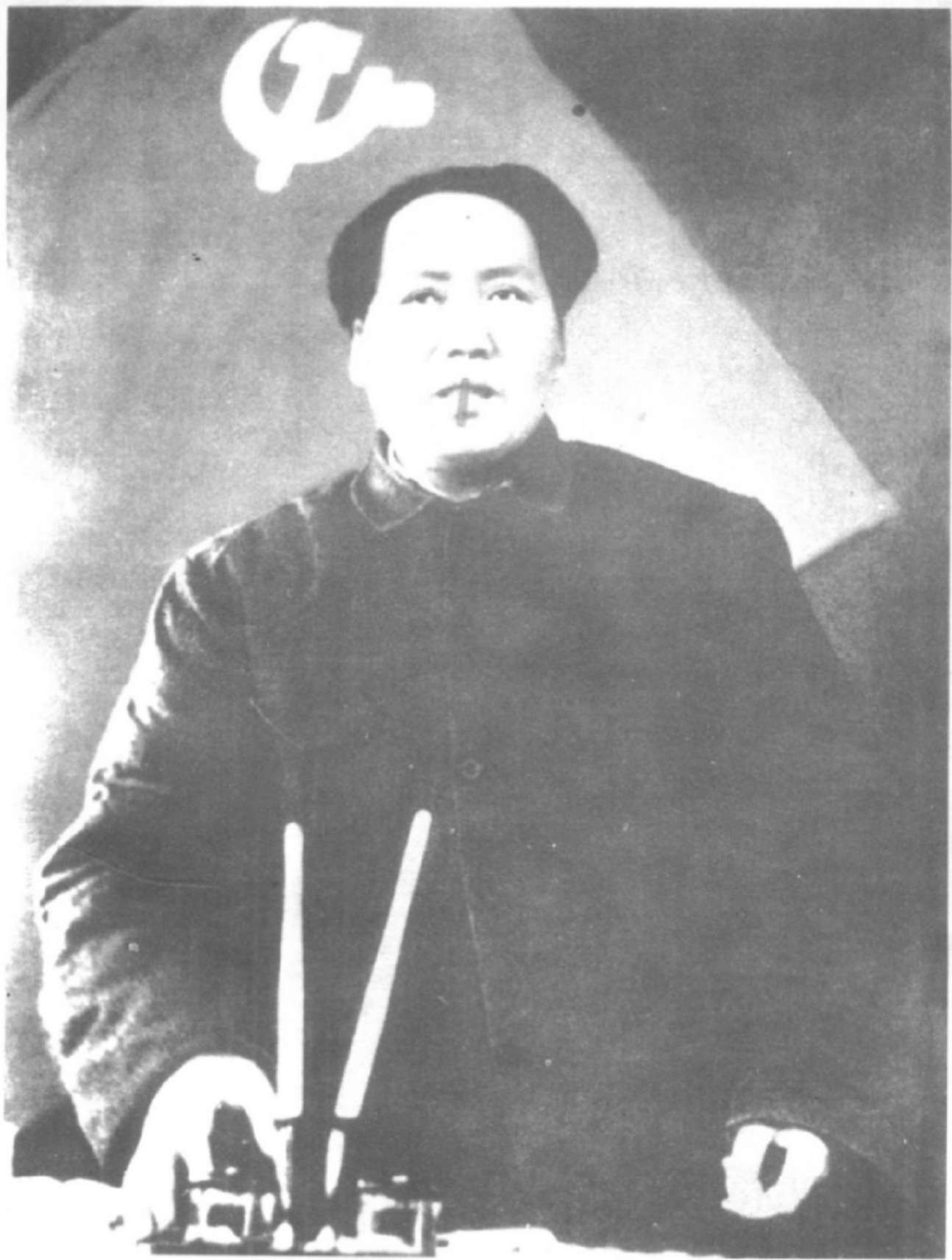
1949年，毛泽东在中共七届二中全会上作报告。