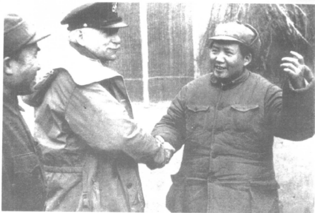
1944年11月，毛泽东和朱德在延安会见美国总统罗斯福的私人代表赫尔利。