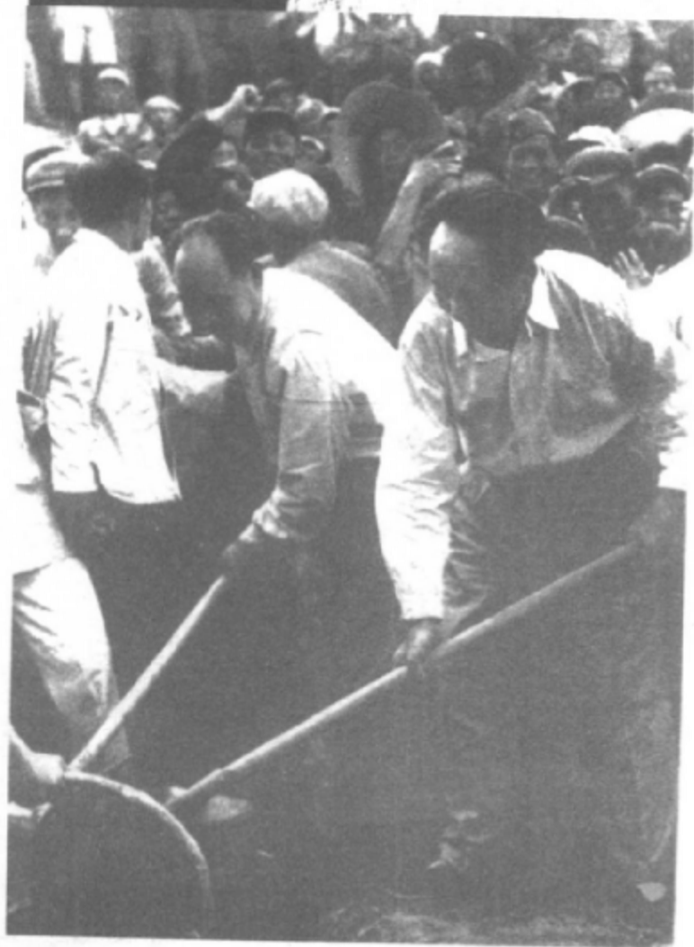
1958年5月，毛泽东在彭真陪同下，在北京十三陵水库工地参加劳动。