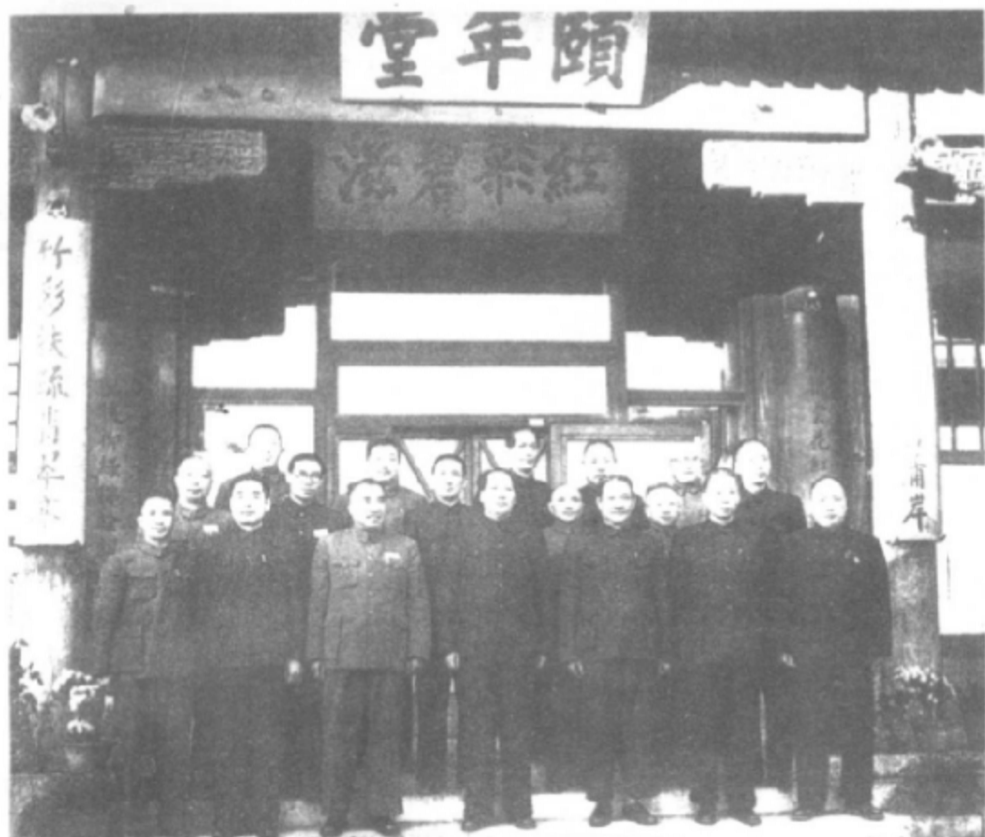
1949年10月20日，人民革命军事委员会举行第一次会议。图为毛泽东和部分委员合影。