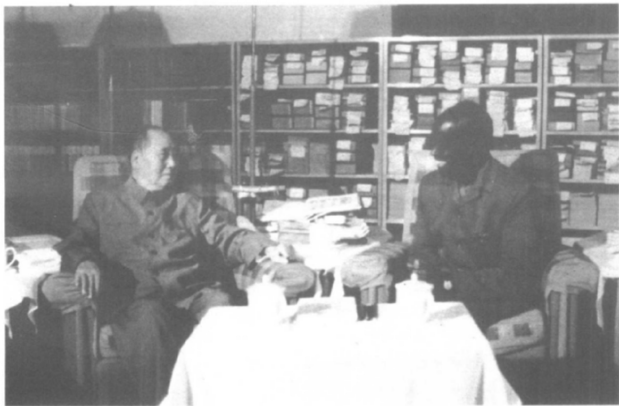
1974年2月，毛泽东会见赞比亚总统卡翁达，阐述了关于三个世界理论，为维护世界和平的斗争指明了方向。