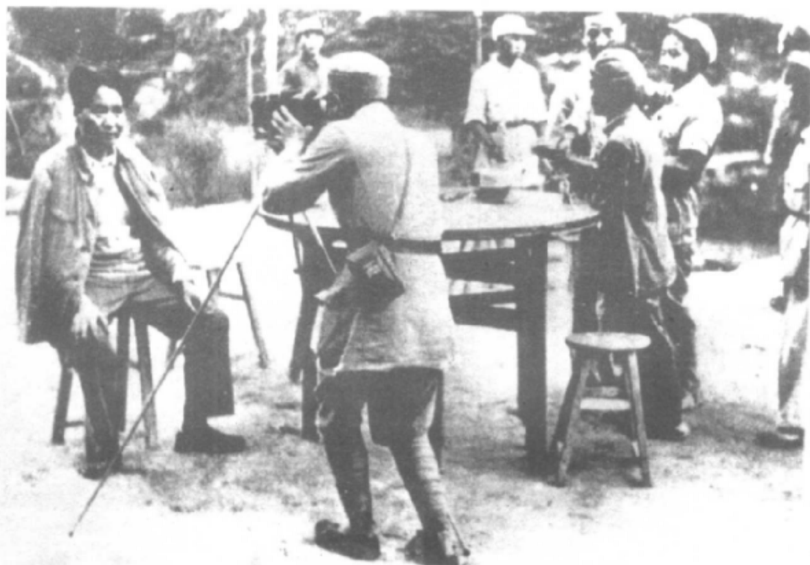
1945年，摄影师吴印咸为毛泽东照像。