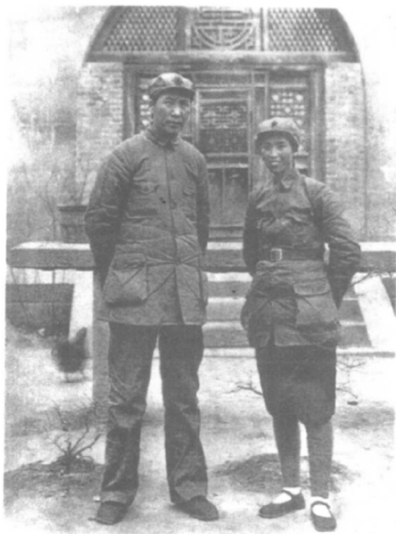
1937年春，毛泽东和 贺子珍在延安。