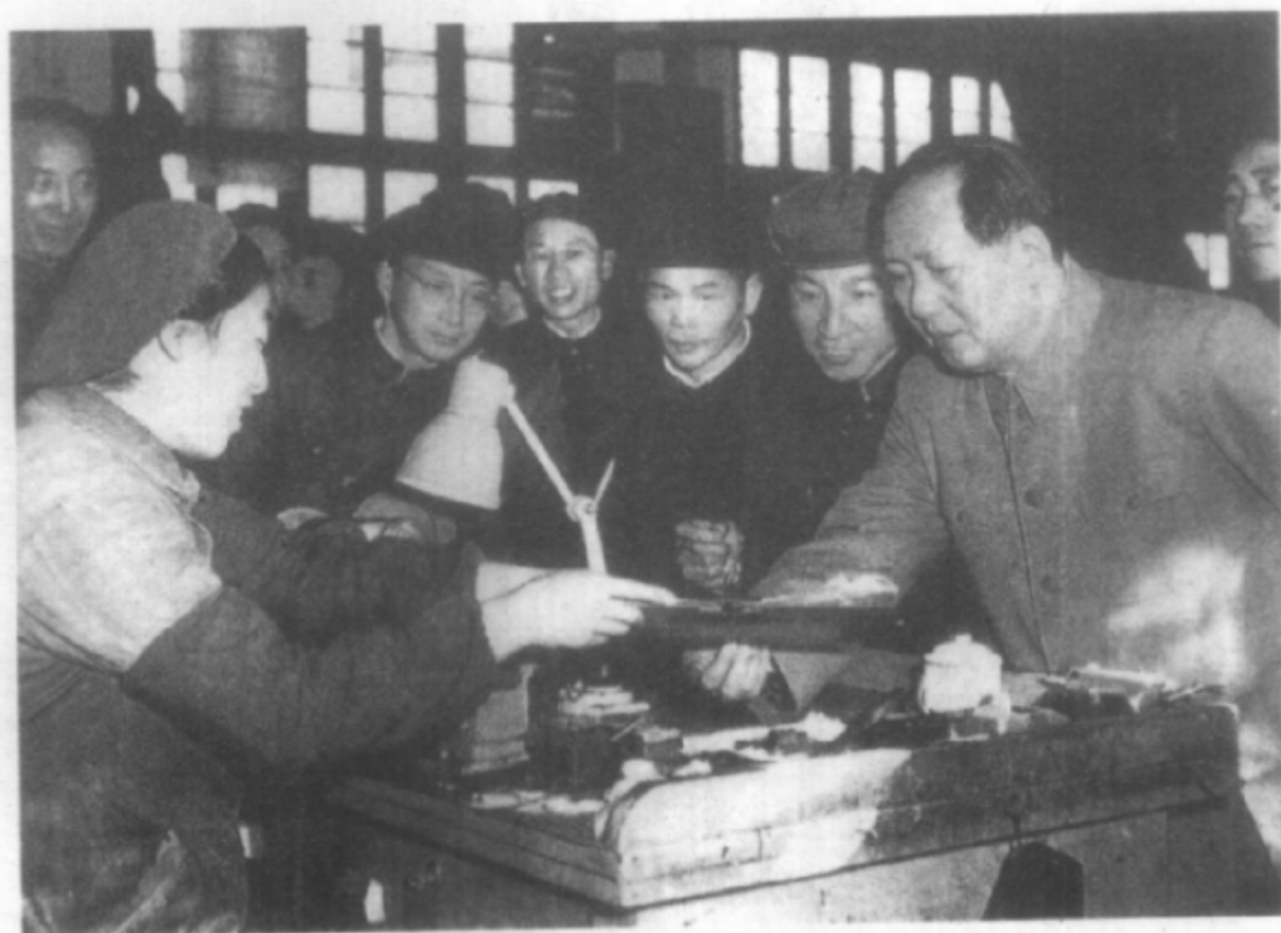
1956年1月12日，毛泽东视察国营南京无线电厂。