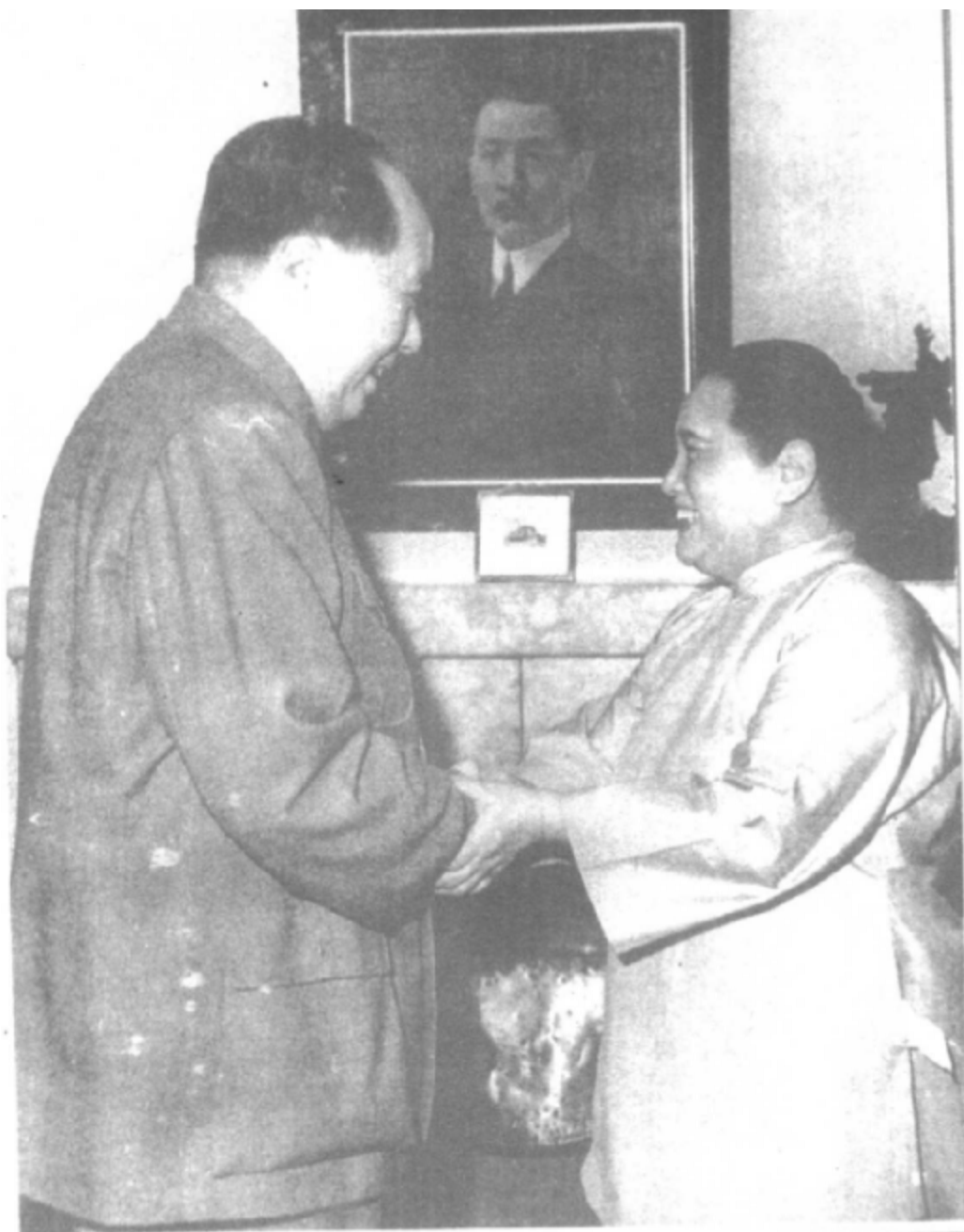
一九六一年，毛泽东在上海拜访宋庆龄。