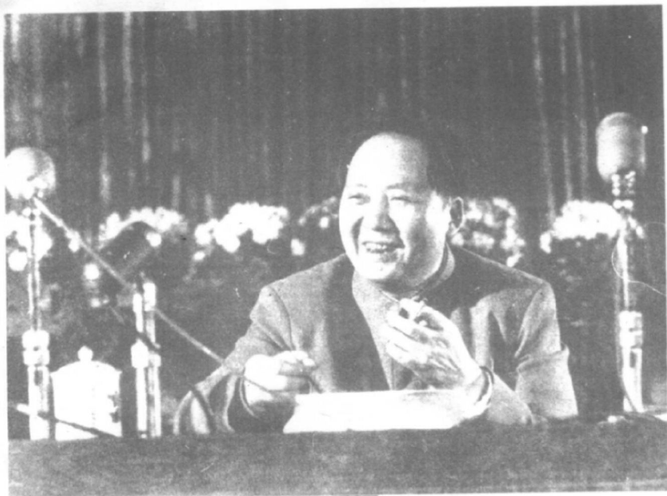
1955年，毛泽东在中国共产党的全国代表会议上。