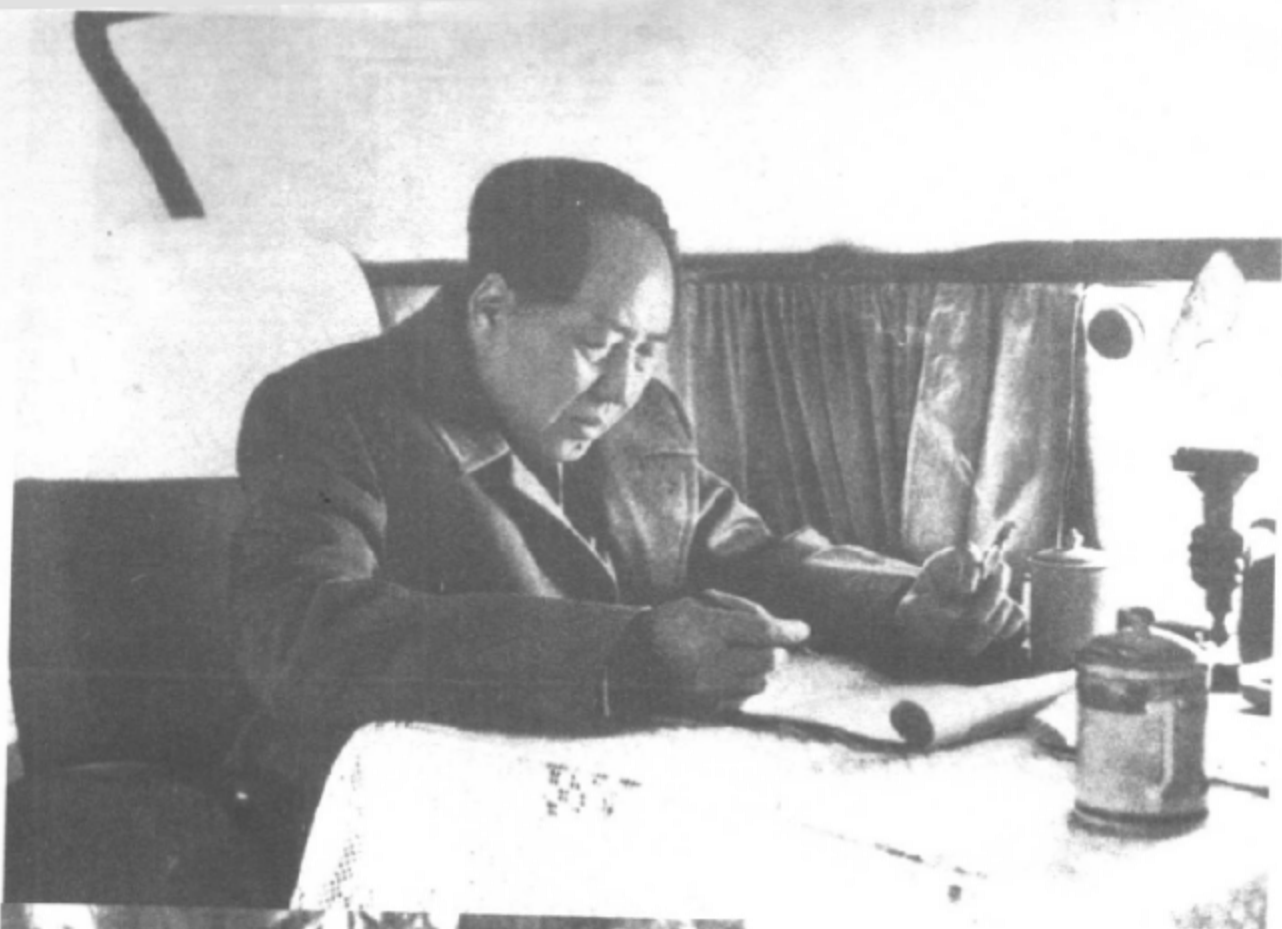
1957年，毛泽东在飞机上学英语。