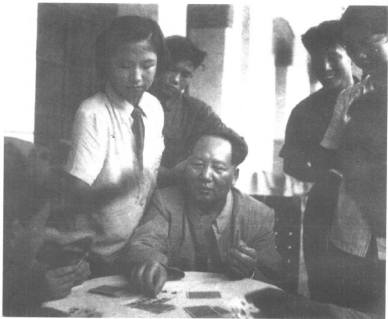
1953年9月，毛泽东和身边工作人员打扑克牌。