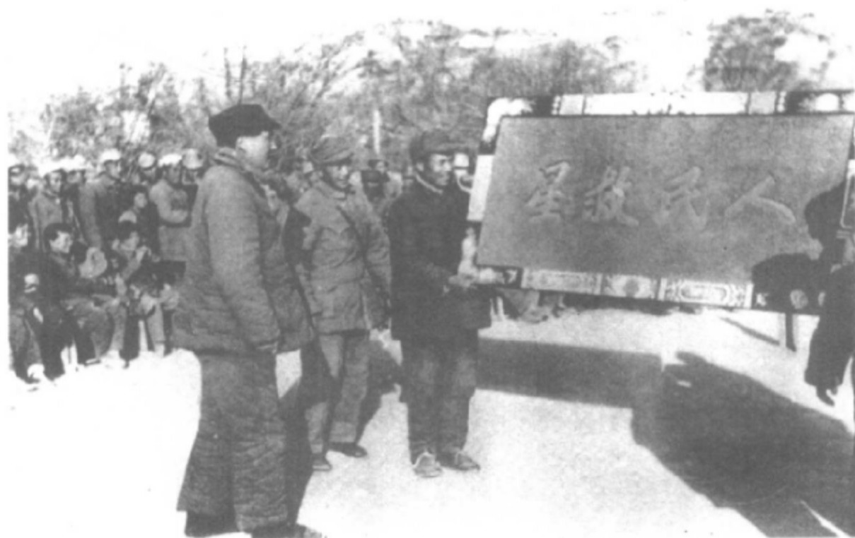
一九四六年，延安军民向毛泽东献金匾。