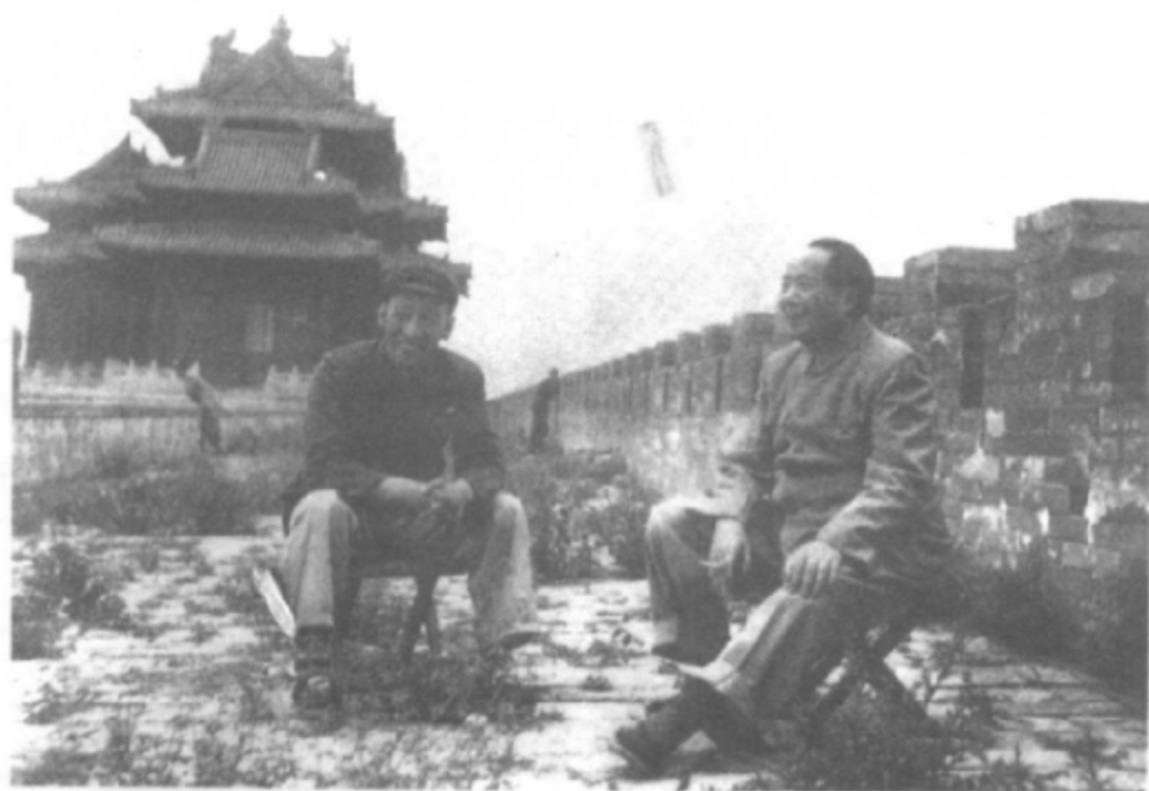
1954年5月，毛泽东在故宫城墙上远眺。