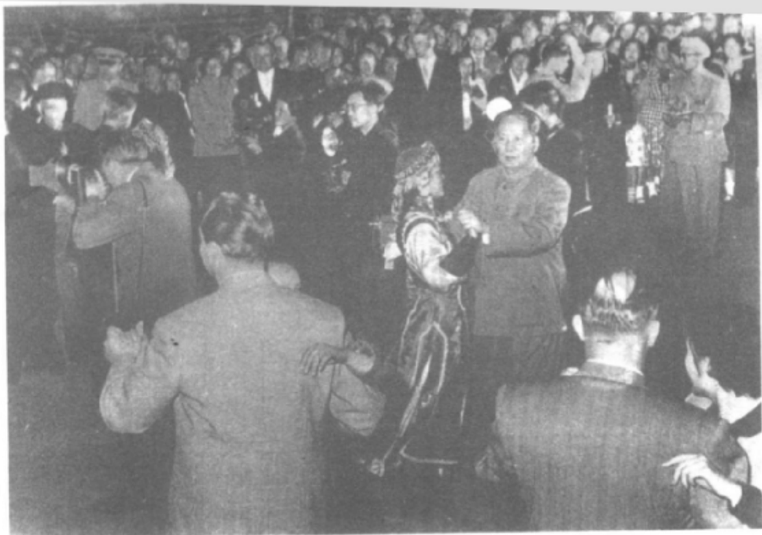
1957年5月，毛泽东在北京中山公园和各界青年欢度青年节。

1957年11月16日，毛泽东代表中国共产党在《社会主义国家共产党和工人党代表会议宣言》上签字。