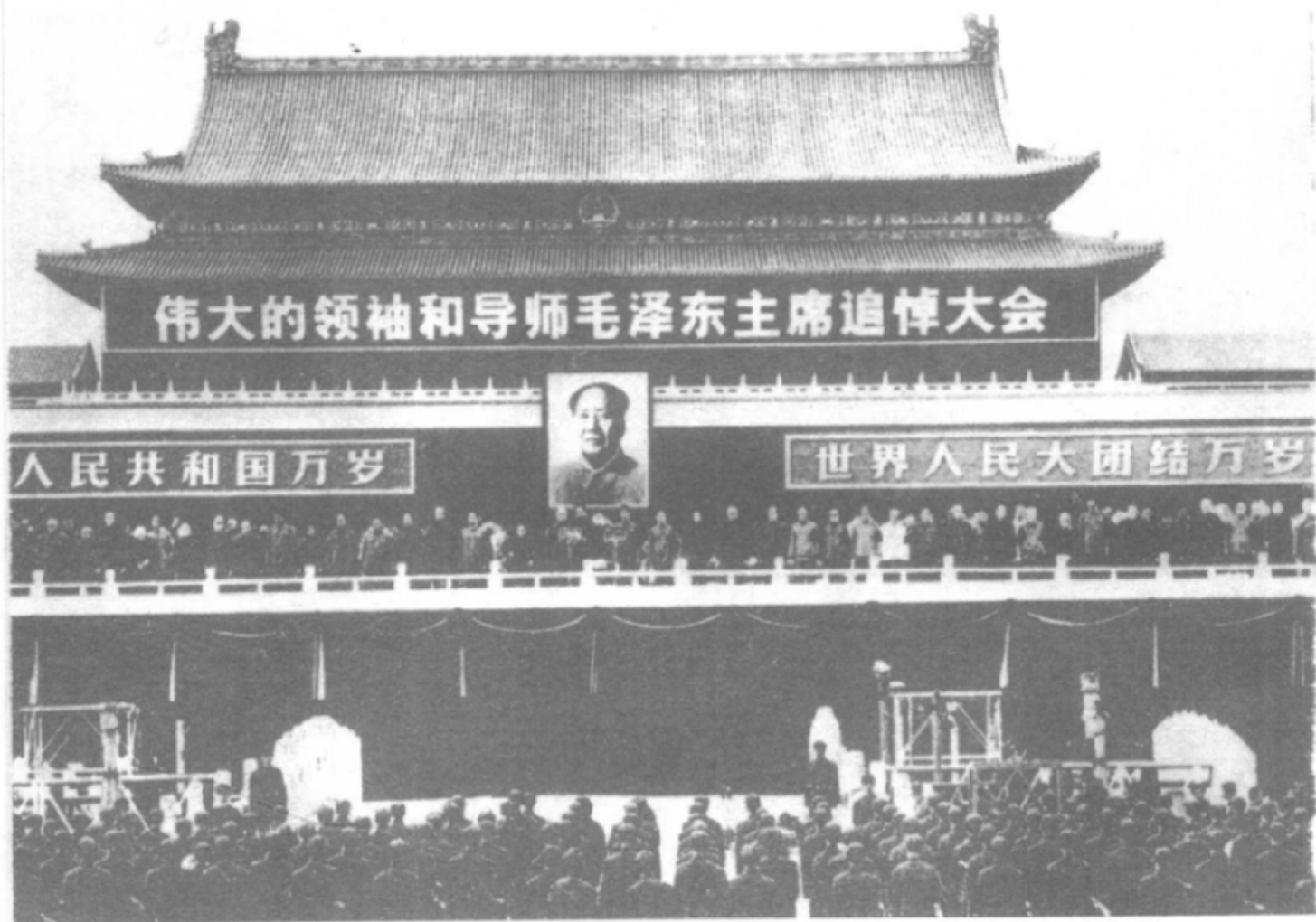
1976年9月9日、毛泽东在北京逝世，追悼大会在天安门广场隆重举行。