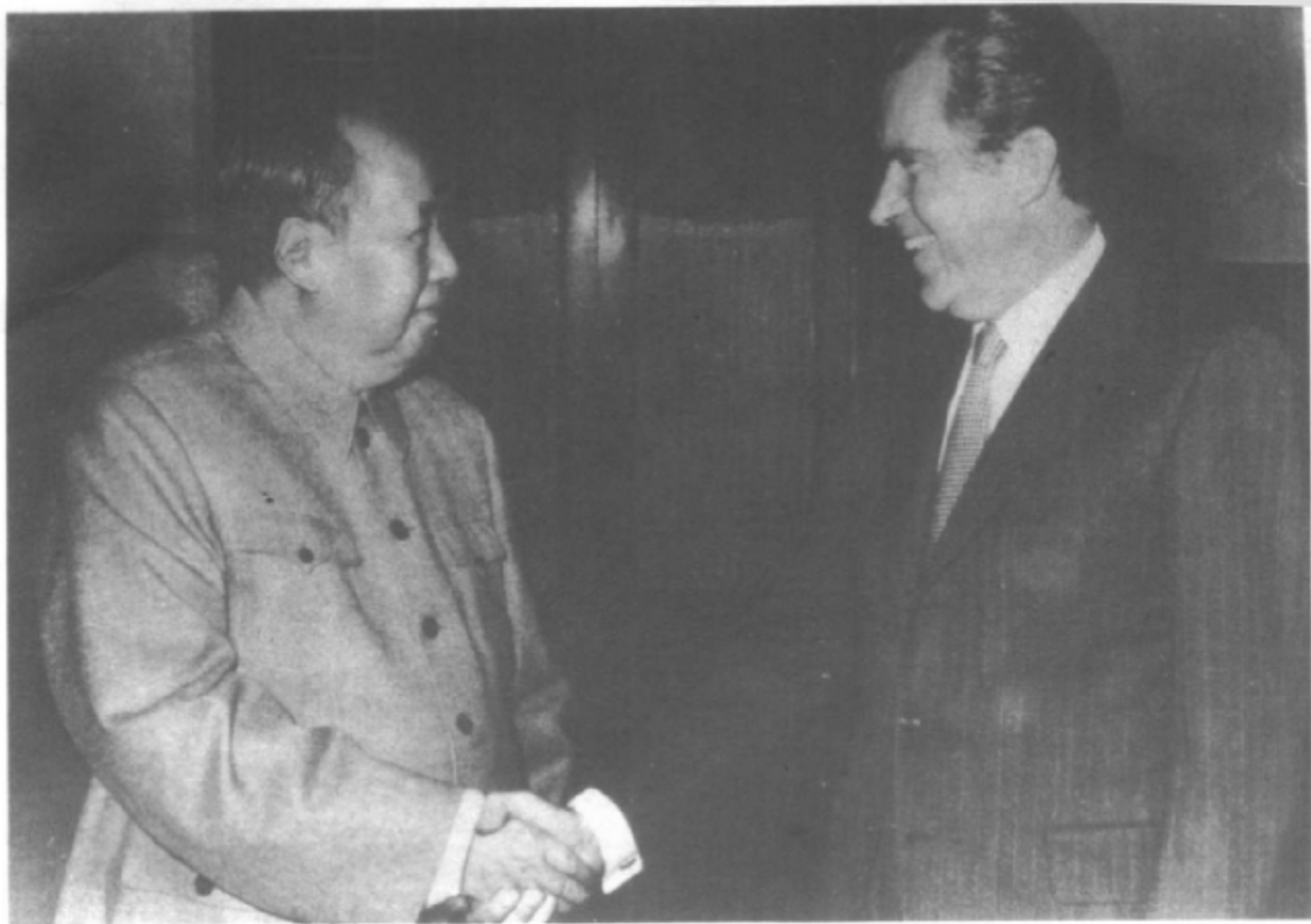
1972年2月21日，毛泽东会见来华访问的美国总统尼克松，中美两国开始走向关系正常化。