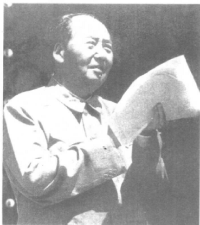
1970年5月21日，毛泽东在天安门城楼。就是在这一天发表了他著名的“五·二〇”声明。