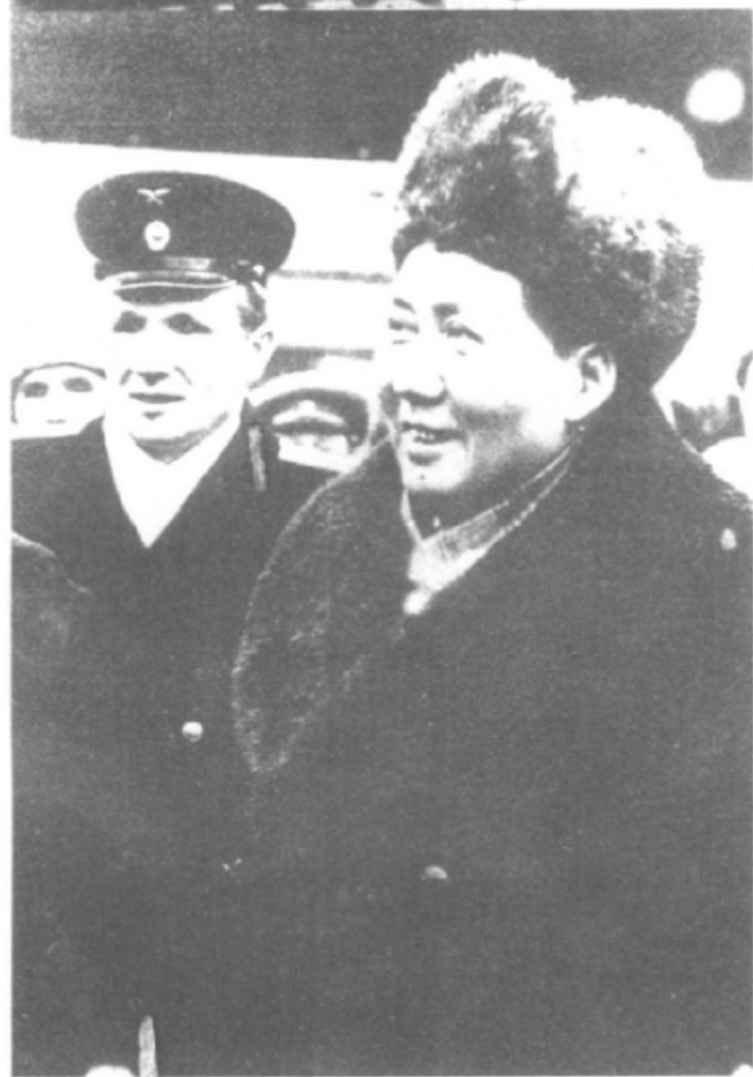
1949年12月，毛泽东首次出访苏联。