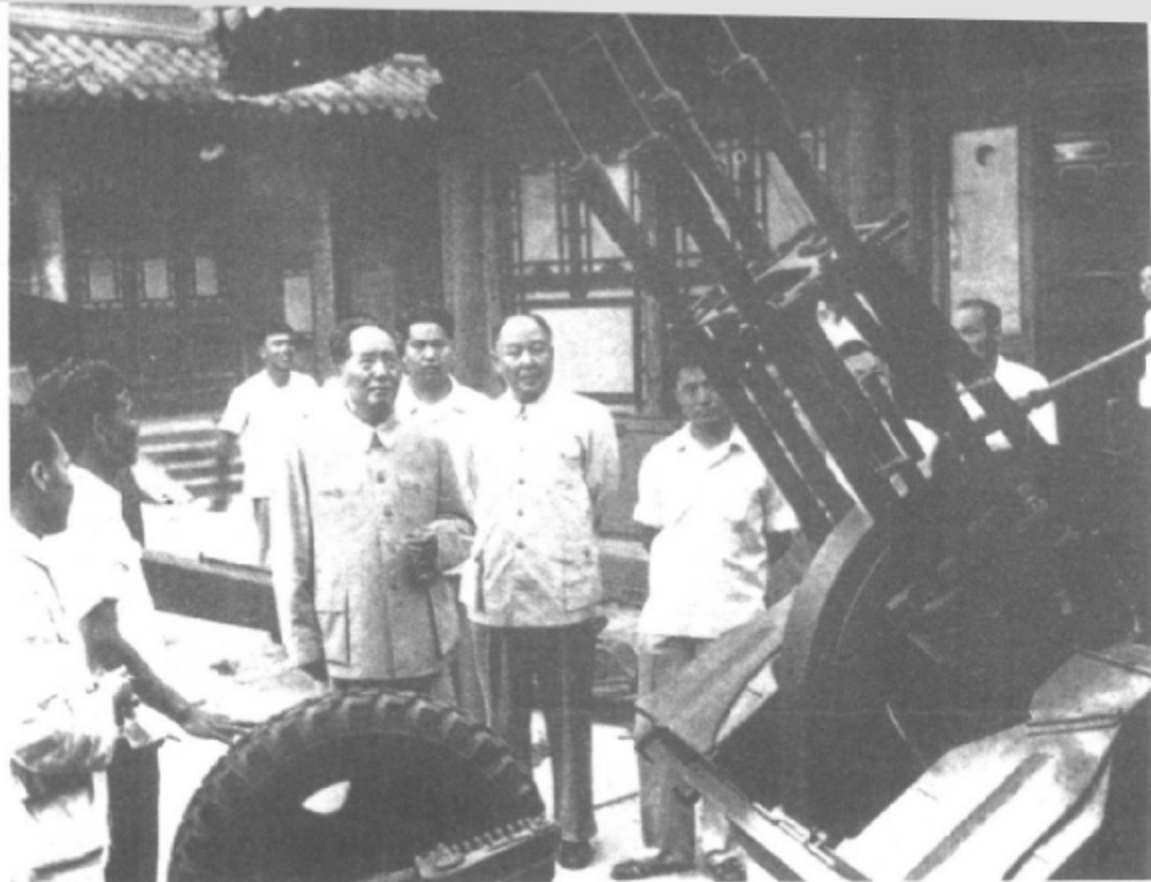
1958年6月，毛泽东在中南海观看我国自己研制的武器。

1959年6月，毛泽东回到了阔别三十二年的故乡韶山。 图为他在父母墓前鞠躬行礼。