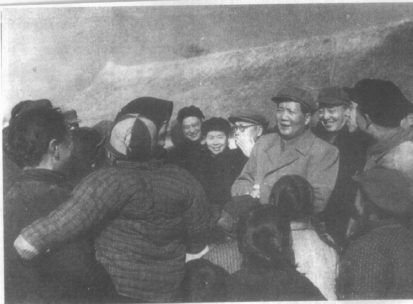
1955年，毛泽东在南京郊区。